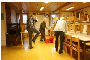
Städning i Prästgårdsbyggårn i Torsby. Foto: Roger Björkstam, 24/11-11.

Höstmöte tisdagen den 30 oktober i Församlingshemmet, Jörlanda. Se kallelse på sista sidan.